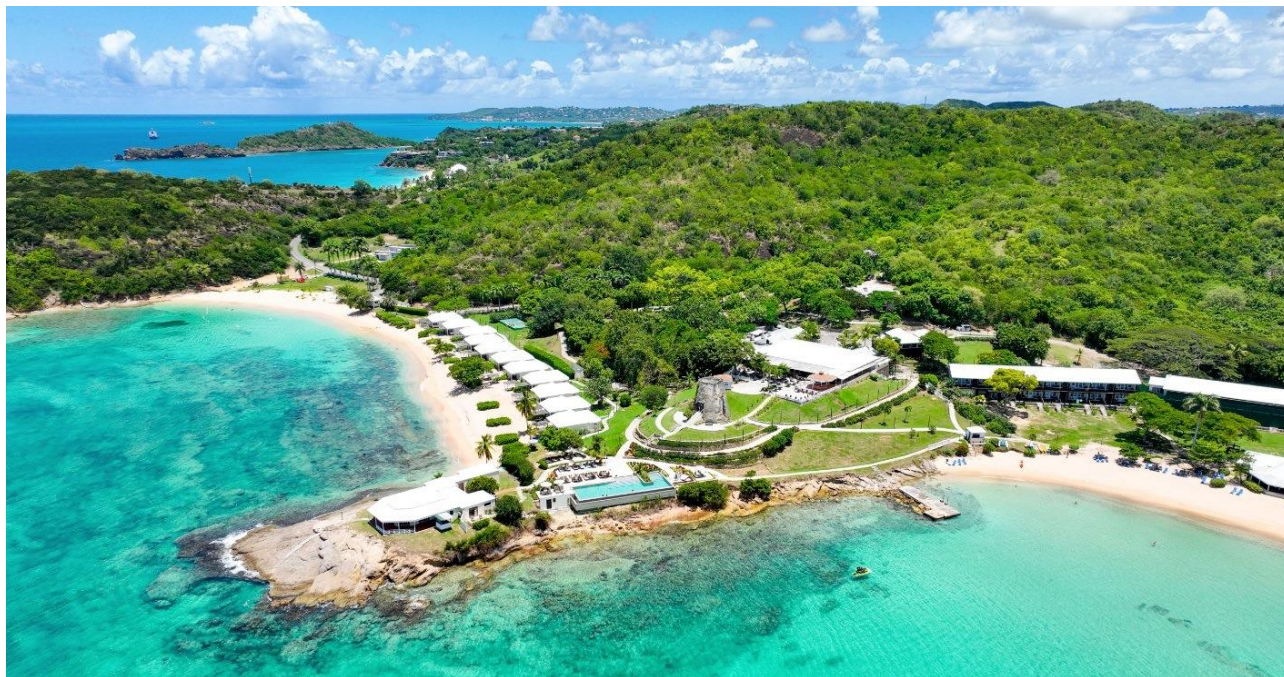
Hawksbill Resort Antigua

Dal 14 al 27 agosto 2025 Partenza da Roma